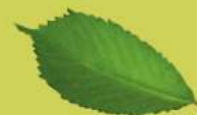
Olmo de montaña (Ulmus glabra)