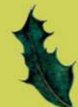
Acebo (Ilex aquifolium)