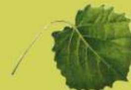
Álamo temblón (Populus tremula)