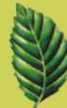
Mostajo (Sorbus aria)