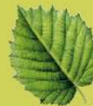
Avellano (Corylus avellana)

Los pinares de pino laricio o negral conforman el paisaje vegetal más representativo de la Serranía de Cuenca. En esta ruta senderista el pinar se asocia con pequeñas manchas de robledal y de bosque mixto eurosiberiano de gran valor paisajístico, como en la Umbría de Fuenlabrada. Especies características de climas más fríos y húmedos, como los avellanos, olmos de montaña, mostajos, acebos y arces, se dan cita bajo escarpes, laderas de umbría y fondos de valle, mezclándose con el pino albar, dando lugar así a un bosque de gran diversidad botánica. Todo este conjunto forestal ofrece con la llegada del otoño una panorámica visual de gran belleza cromática.