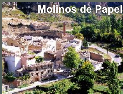
Molinos de Papel