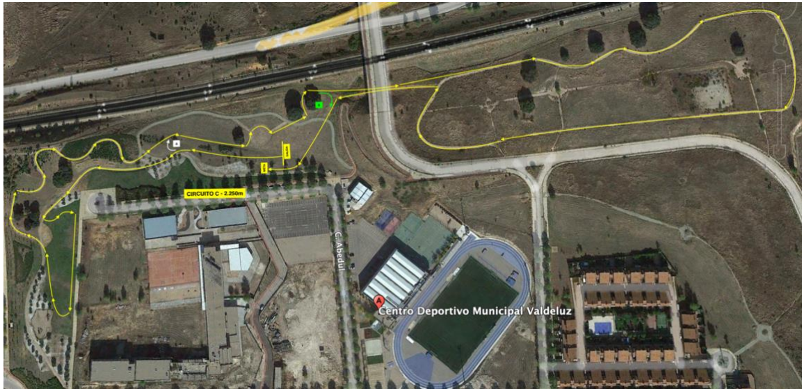
Circuito C – 2.250m