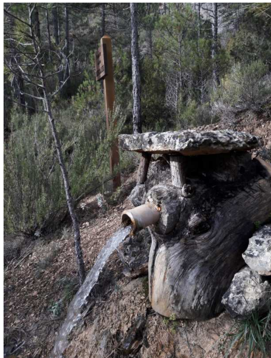
Fuente de los Riscuales